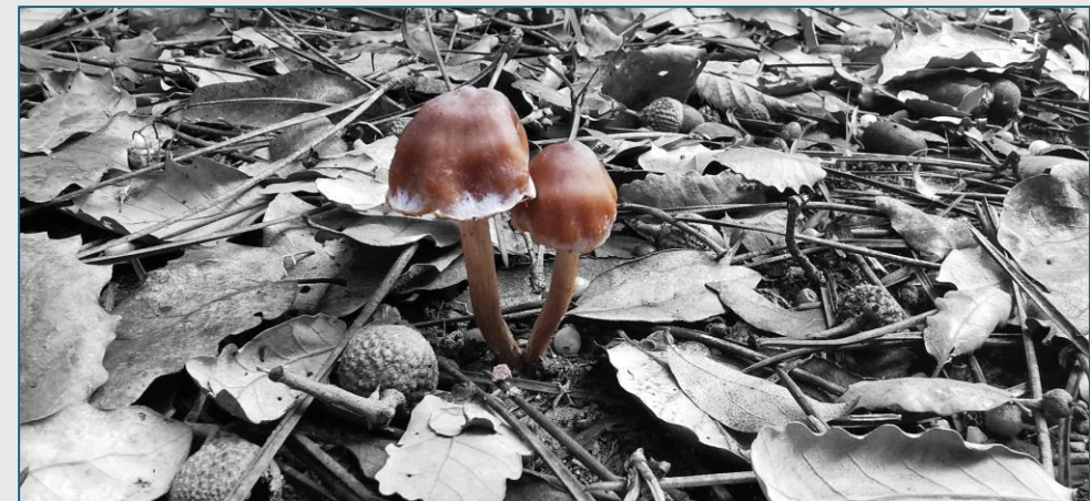
Reserva Natural do Paul de Arzila